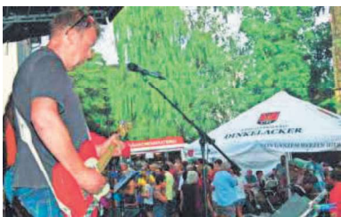
Livemusik und tolle Stimmung.

haben sich an beiden Tagen ins Zeug gelegt, um den Menschen einen Event zu bieten, bei dem groß und klein etwas davon haben. Zwischen Kirche und Gemeindehaus gab es eine Showbühne mit starken Einlagen, hinter der Kirche etwas für die Kids mit Tierschau, Kinderschminken und vielen anderen zeitvertreibenden Sachen. Alle vor Ort waren immens gut drauf. Vor allem die Festgemeinschaft darf sich im Nachhinein glücklich schätzen, dass alles vorzüglich geklappt hat und Möhringen nun um ein tolles Fest reicher ist, bei dem viele Vereine mit anpacken und helfen. Den Initiatoren gilt es dafür ein großes Lob und ein herzliches Danke auszusprechen. rs