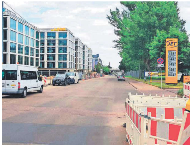
Mit zahlreichen Maßnahmen wird die Industriestraße im Abschnitt Industriestraße 23 bis Nord-Süd-Straße umgestaltet.

Dabei sollen unter anderem folgende Maßnahmen im öffentlichen Straßenraum umgesetzt werden: ein neues Linienkonzept der Buslinie 80, bessere Infrastruktur für den Radverkehr im Bereich der Industriestraße, Ruppmannstraße, Schockenriedstraße sowie am Knotenpunkt Liebknechtstraße/Robert-Koch-Straße, Lückenschluss der Hauptradroute 10.2 zwischen Vaihingen und Möhringen, Erhöhung der Leistungsfähigkeit der Knotenpunkte Nord-Süd-Straße/Heilbrunnstraße, Nord-Süd-Straße/Rampe Vaihinger Straße und Ostumfahrung/Zustraße innerhalb des be-